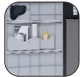
Kast met opbergruimte voor olie, opvangzakken en handleiding