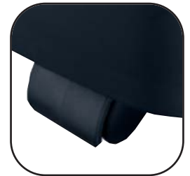
Rolwielletjes verhogen de mobiliteit / flexibiliteit