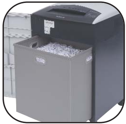
Gemakkelijk te legen dankzij de uitneembare opvangbak