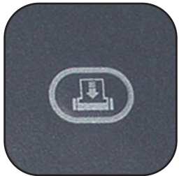
Turbo-jam terugloopfunctie; lost opstoppingen gemakkelijk en snel op